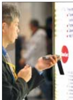
Direkt vor den roten Punkt des beamSPOT hält man den PDA und erhält per Infrarot nach mehrmaliger Bestätigung den Messe-Guide