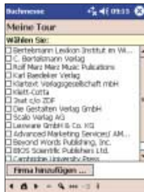
Blitzschnell stellt man mit der Anwendung seine persönliche Messe-Tour zusammen - das geht so mit keinem gedruckten Katalog